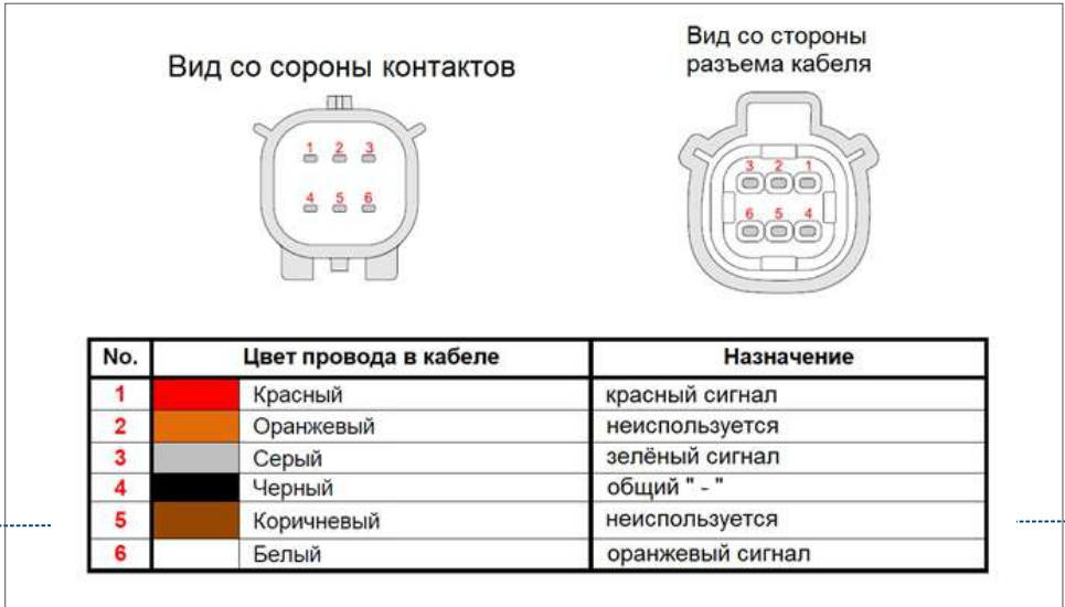
Рисунок 2. - интерфейсный разъем индикатора загрузки