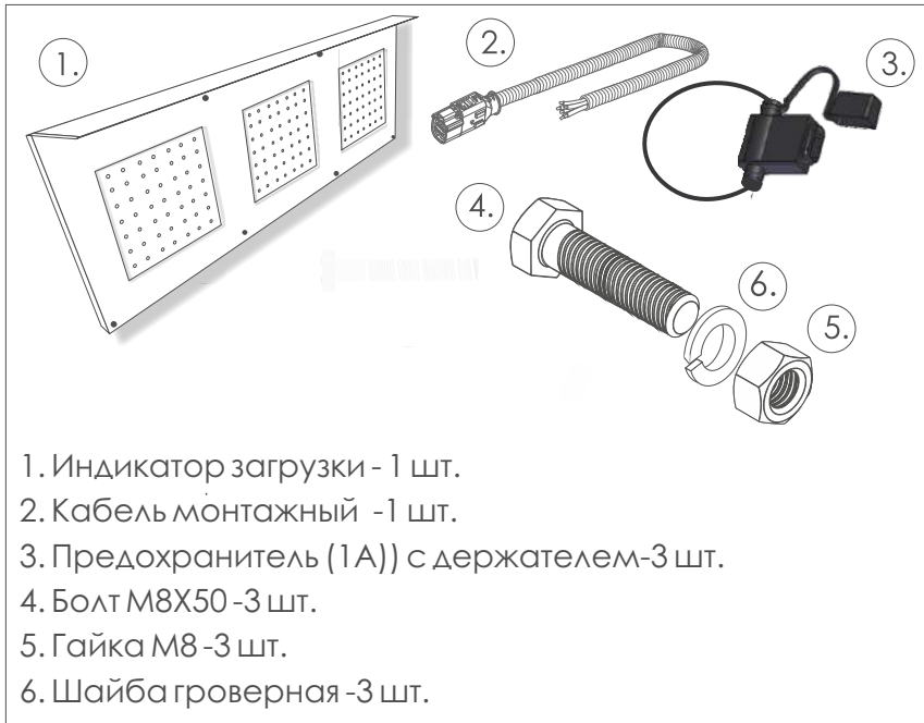
Рисунок 1. комплект поставки